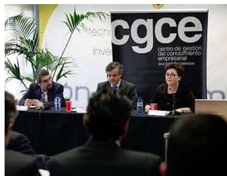
Una imagen del acto de la presentación del estudio de mercado sobre el sector del terciario avanzado

Los servicios más contratados fueron los de finanzas, control de gestión y auditorías (los relacionados con la asesoría financiera, fiscal y contable), utilizados por un 88% de las empresas, mientras que en segundo lugar se encuentran los de publicidad (comunicación y diseño), con un 46,3% de demanda; y calidad ambiental y prevención de riesgos, con un 40,3%, según las conclusiones del citado estudio, que estaba especialmente centrado en los clientes potenciales de este sector.